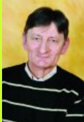
Conseiller municipal délégué à la culture