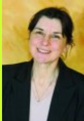
Adjointe à l'Ecologie urbaine et au développement durable