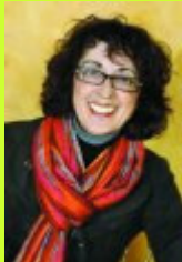
Conseillère municipale déléguée à l'action sociale