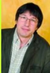
Président du groupe Conseiller municipal